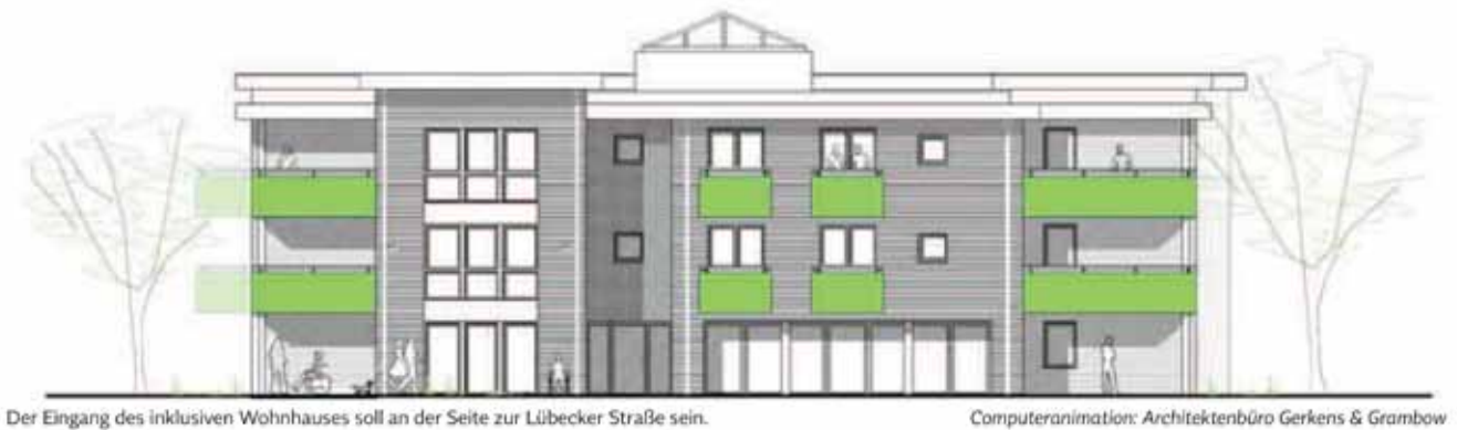
Der Eingang des inklusiven Wohnhauses soll an der Seite zur Lübecker Straße sein.