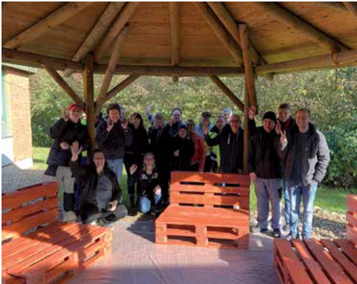
Viele helfen mit beim Bauen der Paletten-Sofas.