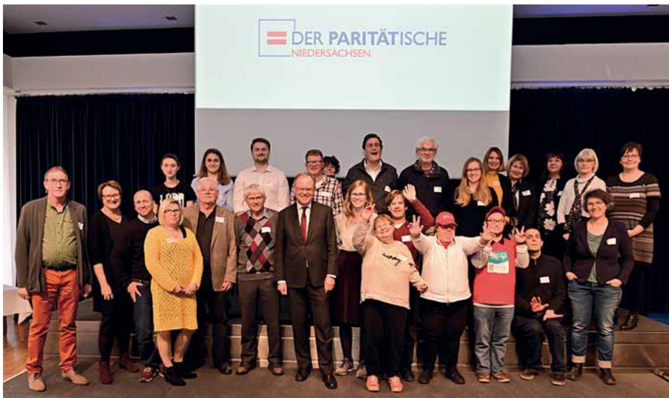
Inklusive Helfergruppe der Lebenshilfe Lüneburg-Harburg erhielt den Ehrenpreis des Paritätischen von Stephan Weil

Anlässlich seines 70-jährigen Bestehens hat der Paritätische Wohlfahrtsverband Niedersachsen e. V. rund 100 ehrenamtlich Aktive aus ganz Niedersachsen mit dem Goldenen Ehrenzeichen und vier Gruppenpreisen des Verbands ausgezeichnet.