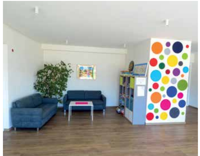
Fröhlicher Gemeinschaftsraum in der Bunten Hanse