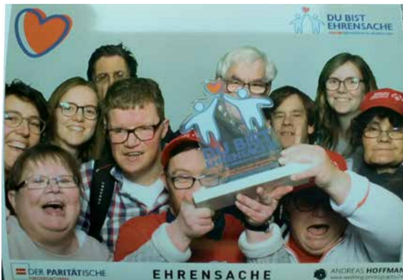
„Juchhu, wir waren alle dabei!“

Im vergangenen Jahr hatte der Paritätische Niedersachsen seine mehr als 860 Mitgliedsorganisationen unter dem Motto „Du bist Ehrensache“ dazu aufgerufen, Menschen für eine Ehrung vorzuschlagen, die sich durch besonderes Engagement in der sozialen Arbeit auszeichnen.