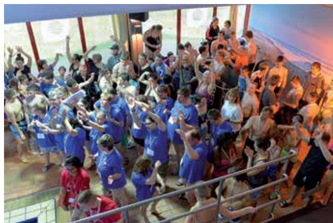
Eröffnung mit Eid der Sportler und der Hymne von Special Olympics

Zum 13. Mal hat die Schule „An Boerns Soll“ ihr Schwimmfest für Menschen mit einer geistigen Behinderung im Hallenbad in Buchholz ausgetragen. Mit 325 Meldungen waren nochmals mehr Sportler*innen für die Schwimm- und Wasserlaufwettbewerbe als im Vorjahr angemeldet.