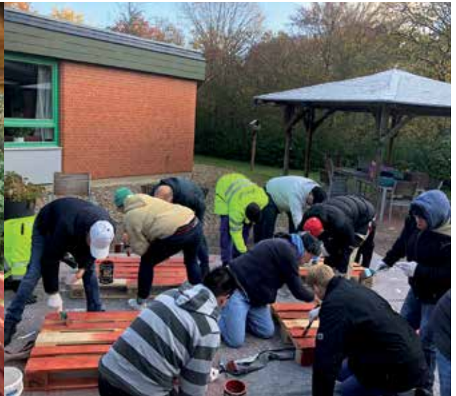
Kekse backen mit Coca Cola Mitarbeitenden